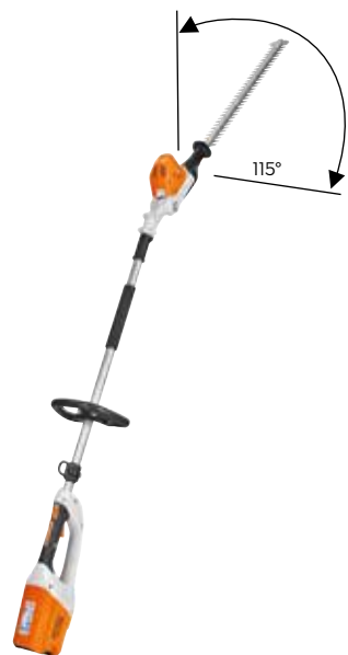
HLA 65 OHNE AKKU UND LADEGERÄT