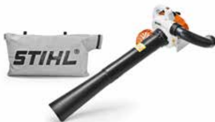
BENZIN-SAUGHÄCKSLER SH 56