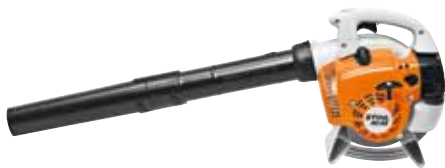
BENZIN-BLASGERÄT BG 56