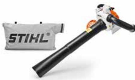
BENZIN-SAUGHÄCKSLER SH 86