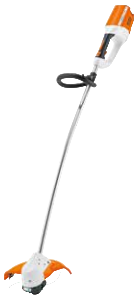
FSA 65 OHNE AKKU UND LADEGERÄT