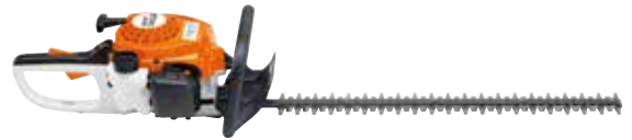
BENZIN-HECKENSCHERE HS 45

Ob Heckenschere, Blasgerät, Saughäcksler oder Motorsäge mit unseren leistungsstarken Benzin-Geräten sind Sie für jede Aufgabe gerüstet. Wir bieten Ihnen eine große Auswahl an STIHL Geräten. Kommen Sie vorbei, wir beraten Sie gerne.