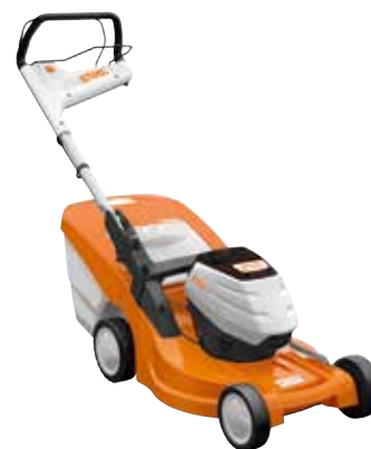
RMA 448 PC OHNE AKKU UND LADEGERÄT