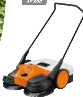
Empfohlener Akku AP 200