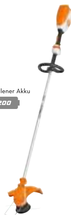
Empfohlener Akku AP 200