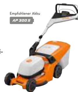
Empfohlener Akku AP 300 S