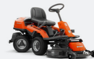
HUSQVARNA R 214TC Briggs & Stratton Motor, Zweizylinder, Hydrostatikgetriebe. Inkl. Mähdeck Combi 94.