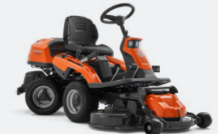
HUSQVARNA R 216T AWD Briggs & Stratton Motor, Zweizylinder, Hydrostatikgetriebe, Allradantrieb. Optionale Mähdecks: Combi 94, Combi 103.

€ 5.199,- exkl. Mähdeck Mähdecks ab € 1.099,-