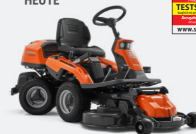
Husqvarna R216T AWD