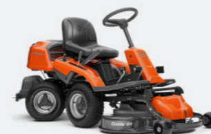
HUSQVARNA R 213C Briggs & Stratton Motor, Hydrostatikgetriebe. Inkl. Mähdeck Combi 94.