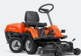
HUSQVARNA R 112C5 Briggs & Stratton Motor, manuelles Getriebe. Inkl. Mähdeck Combi 85.