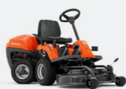
HUSQVARNA R 115C Briggs & Stratton Motor, Hydrostatikgetriebe. Inkl. Mähdeck Combi 95.