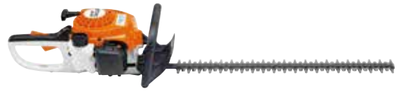
BENZIN-HECKENSCHERE HS 45

Ob Motorsense, Heckenschere oder Motorsäge mit unseren leistungsstarken Benzin-Geräten sind Sie für jede Aufgabe gerüstet. Wir bieten Ihnen eine große Auswahl an STIHL Geräten. Kommen Sie vorbei, wir beraten Sie gerne.